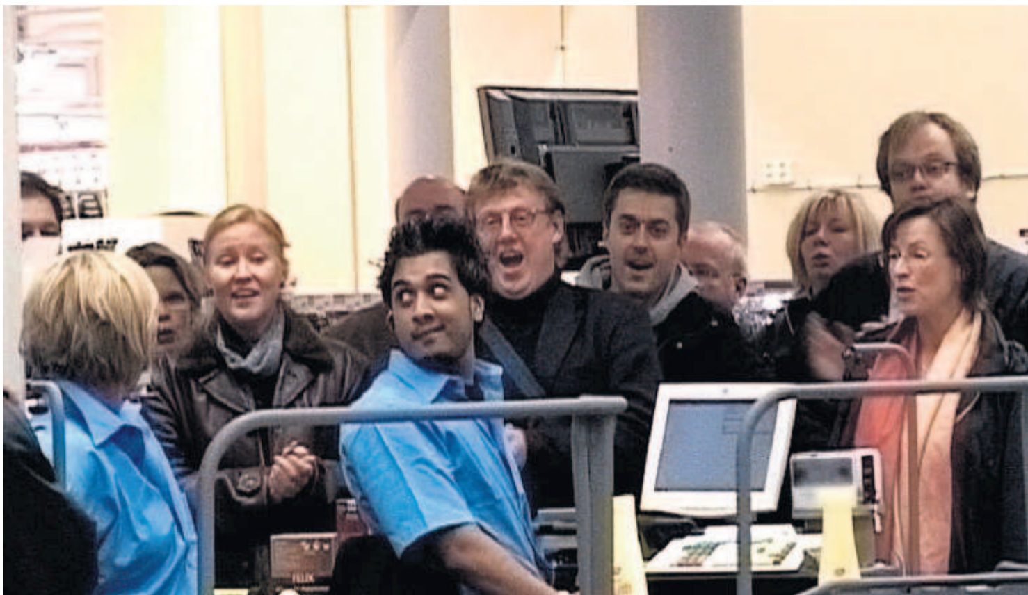
PLÅNBOKEN KRYMPER. Svensk reklamfilm håller fortfarande världsklass – här Radiotjänst som vann guldägg för sina tackfilmer som visats i SVT:s kanaler – men det tuffa ekonomiska klimatet gör att det blir allt svårare att behålla positionerna när budgetarna krymper.